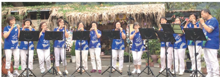
▲頭份天主堂陶笛柔美樂音表演