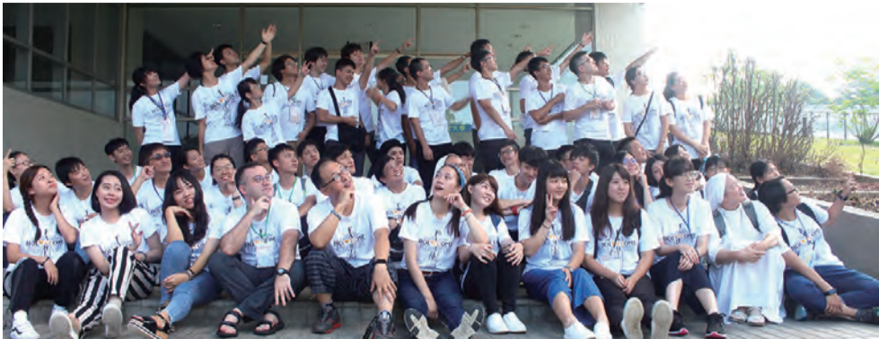
▲陶成營讓我們在主內歡喜相遇