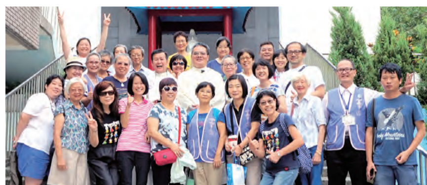
▲全體在聖母亭前留下歡樂美憶