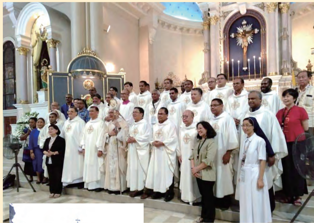
▲參與感恩聖祭後，與會者喜樂留影。

原來這座位於菲律賓中央呂宋的一省，在1991年6月曾經因Pinatubo火山爆發而造成毀滅性的大浩劫。這是一場20世紀以來規模第二大的火山爆發，火山灰覆蓋50億平方公尺的面積，揚起3400公尺高的火山灰，所幸當