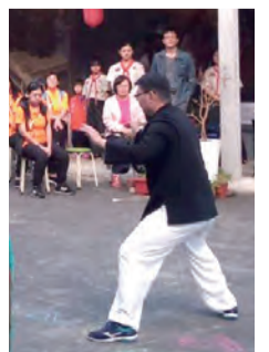
▲紹剛老師功夫了得