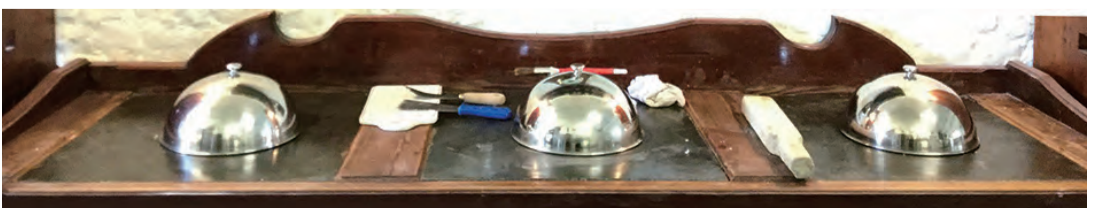
▲圖5：鎖住調香後乳香團的罩子。