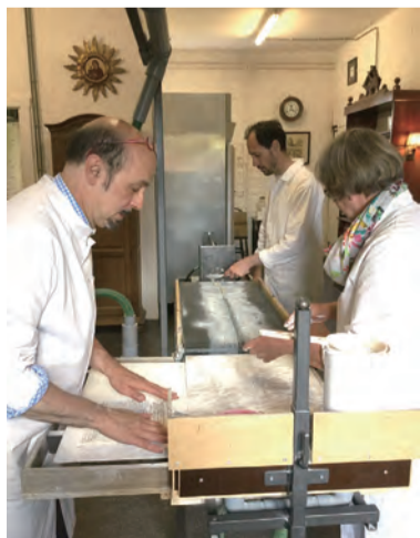
▲圖6：塑成條狀後的乳香。