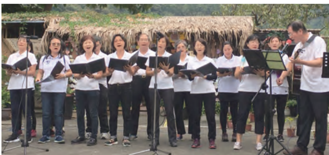
▲西門街耶穌聖心堂聖詠團演唱

內灣天主堂的福傳音樂會在10月19日下午5時畫下句點。但是，天主把種子撒在每個人的心田裡，希望回到自己的家庭時，要繼續耐心灌溉，讓種子發芽生長，期待明年開枝展葉，再相聚在內灣。