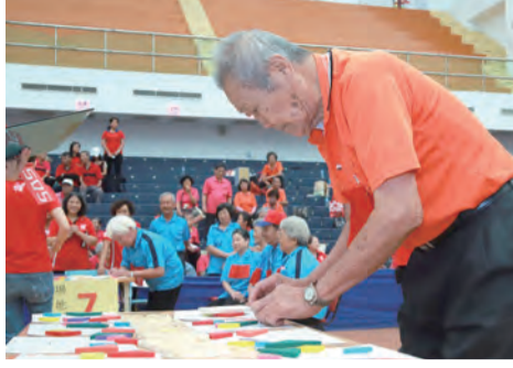
▲▲「超級金頭腦」用七巧板拼出新樂趣