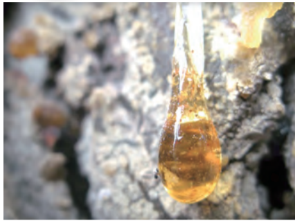
▲圖2：乳香樹分泌的樹脂，俗稱「樹的眼淚」。