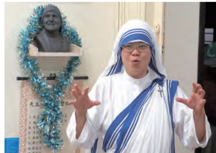
▲造訪仁愛傳教修女會台北會院，王修女幽默分享聖德蘭姆姆的愛。