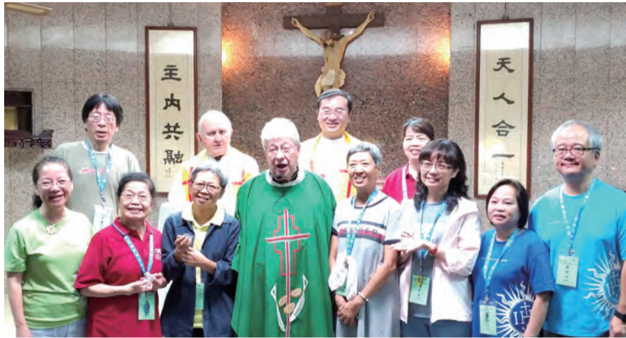
▲永奉團員25周年贈予金色徽章紀念

為積極回應今年大會主題：「在人群中活出信仰」，基督生活團全國執委會特別研擬4個座談會，主題分別是：同婚立法、病人自主權立法、梵蒂岡與中國談建交、長榮空服員罷工。邀請韋薇修女與團員擔任主講人，講述議題背景。團員一起思考並進行雙向問答，分組討論。希望團員經由這些社會國際事件，反省對這些事件的反應是什麼？遇到哪些挑戰？身為一位團員如何回應？耶穌為何能讓大批群眾聽祂？信仰與基督生活團的身分是否影響了我們的