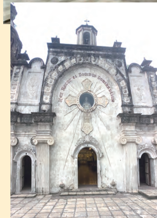
▲從火山灰中復活的教堂內部及外部