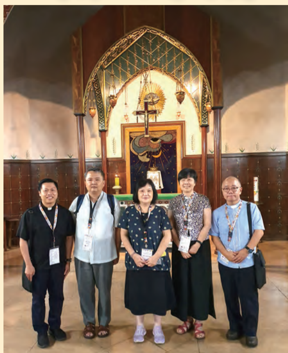
▲全體與會者大合照