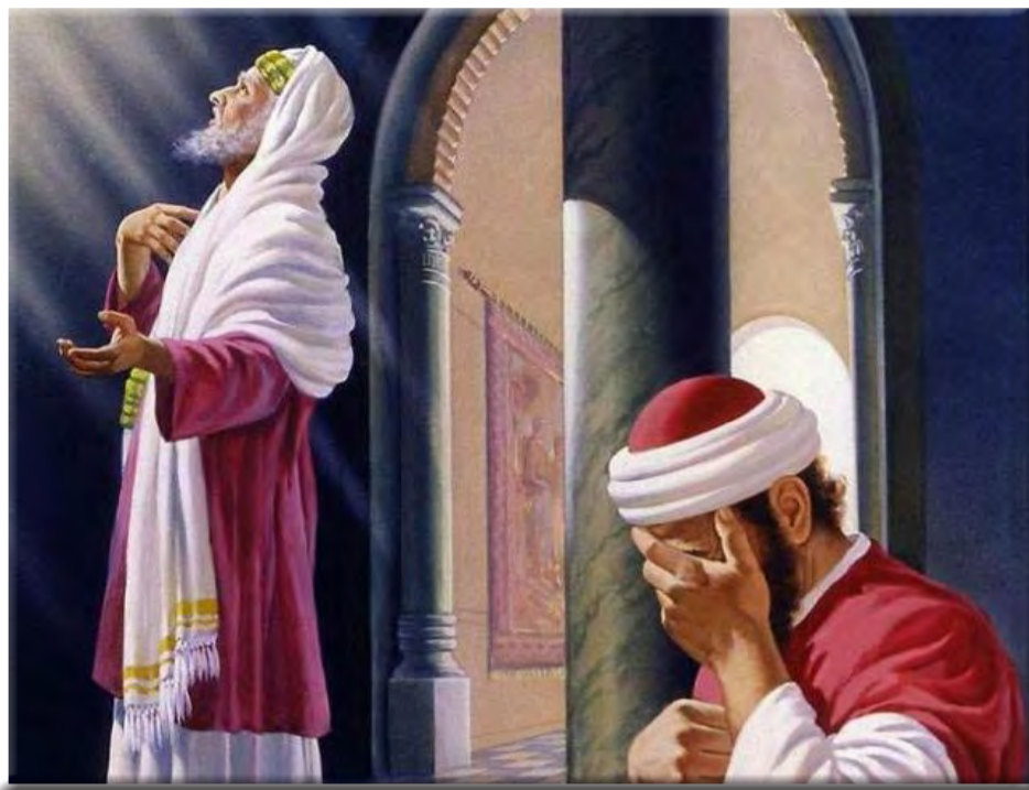
▲我們每個人都要向天主交帳，思言行為符合正義與道德標準，是原本就該具備的，不應拿來誇口，覺得自己比別人來得高尚或虔誠；犯錯的人也不須自慚形穢而絕望，只要痛悔，改過遷善，天主的慈愛永遠比我們的罪來得大。