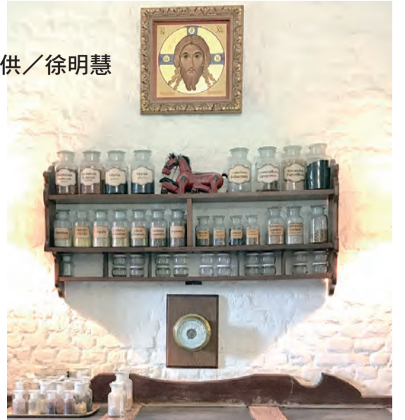
▲圖3：工作坊中各式各樣的乳香。

雪維凍泥爾 (Chevetogne) 修道院工作坊所製的乳香，稱為「希臘乳香」，來自南蘇丹產地；不過最原始的乳香卻是原產自埃及。古埃及文明盛期，製作木乃伊即以乳香作為人工防腐處理的原料。在亞歷山大大帝統治埃及後，雖將埃及希臘化，但埃及固有的乳香製作及法尤姆 (Fayoum) 肖像藝術反而融入了希臘文化，爾後又進而影響了拜占庭帝國內的文化發展。