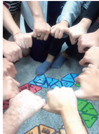
▲在遊戲共融中愛與學習