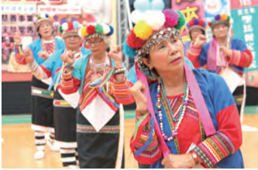
▲阿里山長青活力站鄒族長輩為活動帶來開場表演